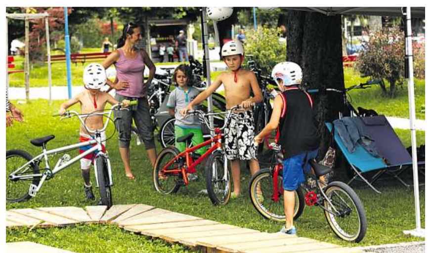
Abwechslungsreiches Rahmenprogramm: Für die hungrigen Wakeboarder gibts Pizza, frisch aus dem Ofen – und auch die kleinen Gäste haben mit dem BMX-Rad ihren Spass auf dem Trockenen.