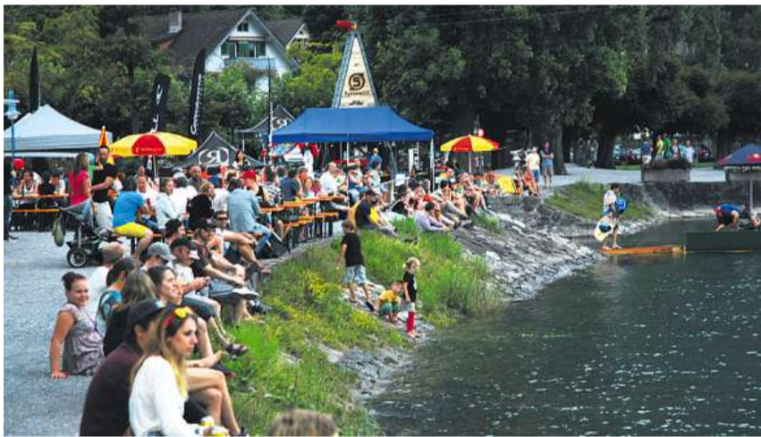
Tollkühne Tricks, staunendes Publikum: Die Profis zeigen gekonnte Sprünge über die Kicker und Rails, die Zuschauer verfolgen gebannt das Spektakel im Hafengebäck.